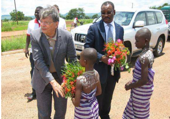
L'accueil à l'entrée de Dapaong