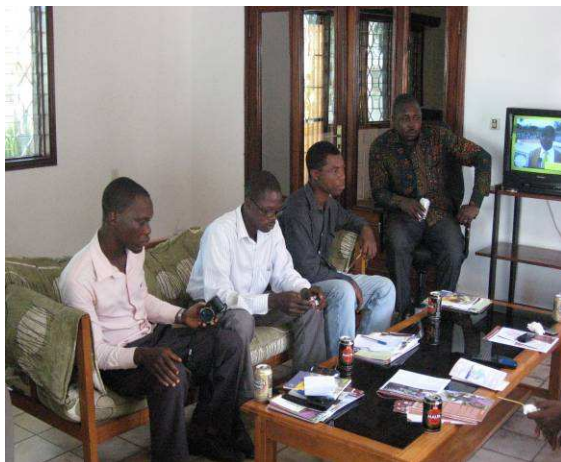
Vue partielle des journalistes présents

ambiance détendue où les participants peuvent parler de sujets d'intérêt commun et renforcer leur coopération.