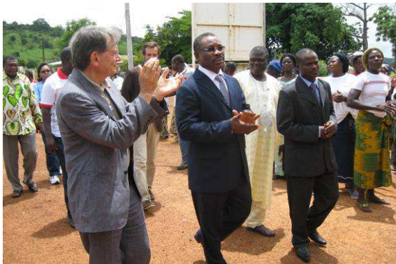
L'arrivée à Bombouaka