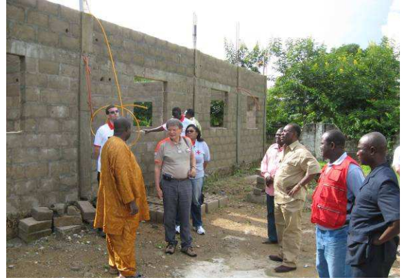
Visite du chantier du CCEJ en construction