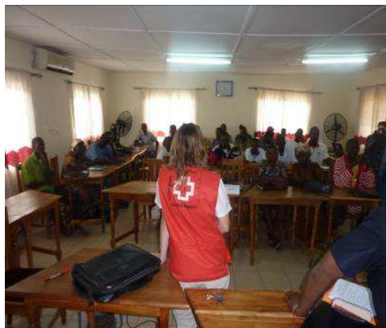
Vue de la salle lors de la formation

des équipements remis aux CM et aux groupements.