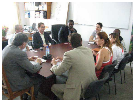
Séance de travail entre le Prof MATTEI et les partenaires de la CRT

l'hôpital et visité le chantier de construction du logement des infirmières stagiaires. Dans la deuxième, il a visité les ouvrages réalisés dans le cadre de la coopération décentralisée avec la Délégation de Villejuif et procédé à l'inauguration d'un bâtiment comportant une pharmacie, un centre d'Etat-civil et le siège de la section locale de la Croix-Rouge.