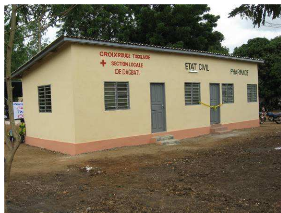
Le bâtiment inauguré à Dagbati